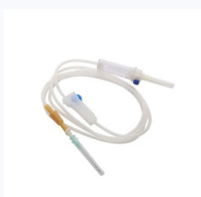
Bajante de Suero