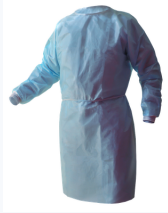
Bata Mangas Cortas

Equipos de protección personal (EPP) para el personal clínico y quirúrgico. Desechables de alta barrera para garantizar la seguridad en cada procedimiento.