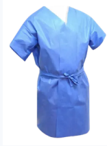
Bata Mangas Largas